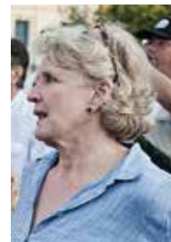
Marie-Christine Barrault Marraine du Festival

Depuis plus de 20 ans, la Fondation Abbé Pierre accueille, accompagne, soutient, écoute des personnes en grande précarité. Mais au-delà de ces actions, les associations qui composent le réseau de la Fondation proposent toute l'année des ateliers de création artistique qui permettent à chacun de retrouver la confiance, la dignité, l'envie de se reconstruire et de se projeter dans l'avenir.